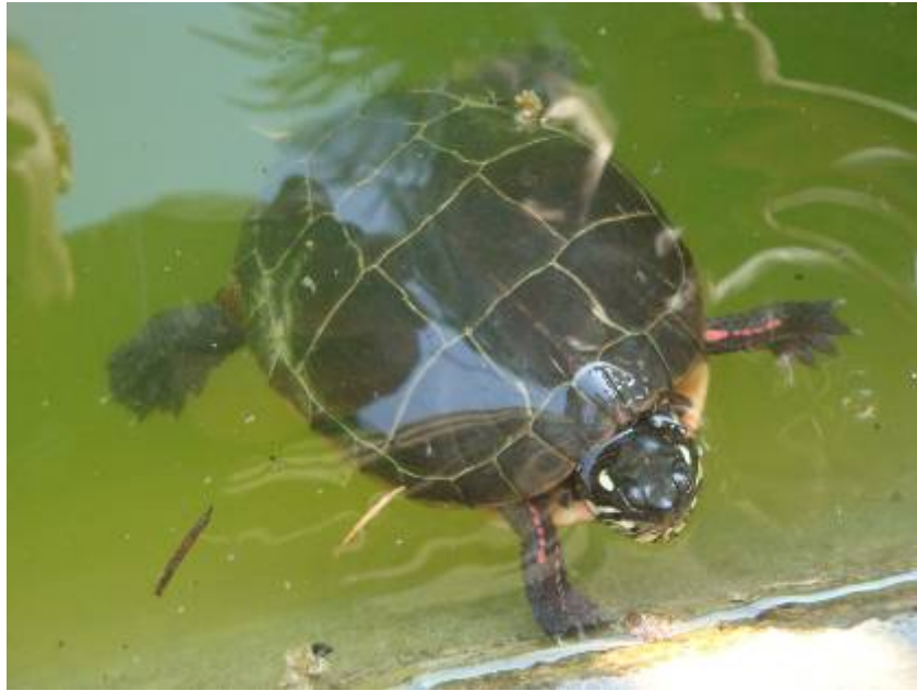
Chrysemys picta picta